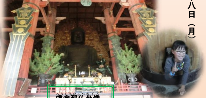
いんぎょうぞう 盧舎那仏坐像