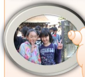
柿くへば鐘が 鳴るなり法隆寺 正岡子規