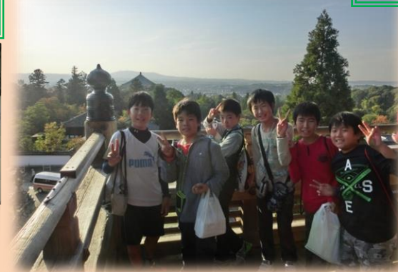
二月堂から見下ろした奈良の都