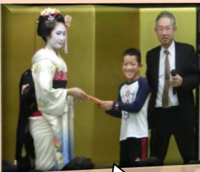
舞妓さんに 賞品をいただ きました。大 芸の道は変 だといふこ とが分かりま した。