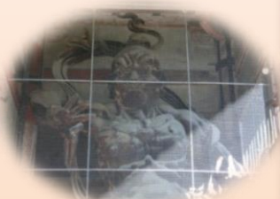
うんぎょうぞう 吽形像