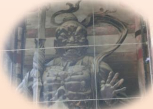
あびょうぞう 阿形像