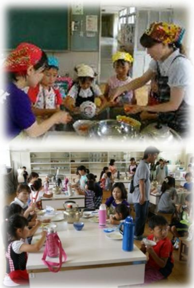
6月18日 PTA文化教養部主催 親子クッキング教室

コープあいち岡崎センター「食と健康アドバイザー」の6名を講師にお招きし、19家族、50名の親子が参加しました。メニューは、「鶏のあんず風味焼き&スカッシュゼリー」でした。