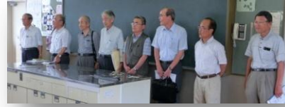
俳句作りの講師をしていただいた先生方