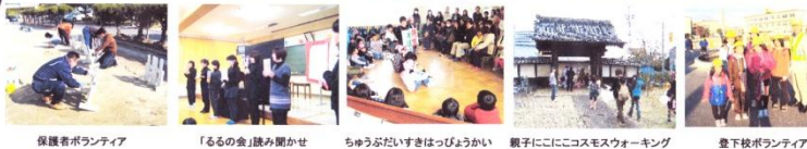
保護者ボランティア

学校評議員会 学校評価 学校支援ボランティア 参観デー 開かれた学校づくり なのはなネット なのはな通信 学校ホームページ