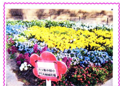
<校門前のPTA地域花壇に>