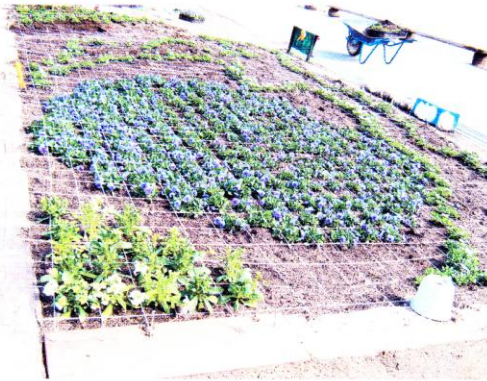
<メイン花壇への植え込み>