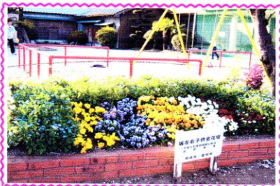
<坂左右町の花壇にも>