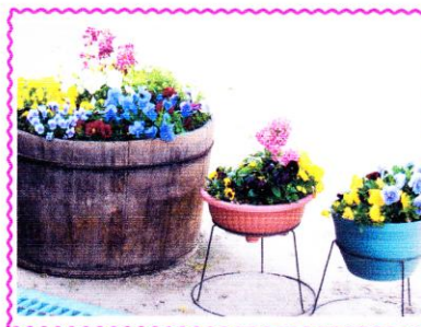
<校内に寄せ植えも>