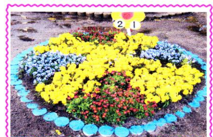
<学級の花壇は工夫して>