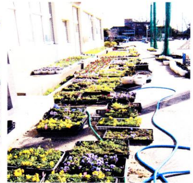
<植え替えを待つ花たち>