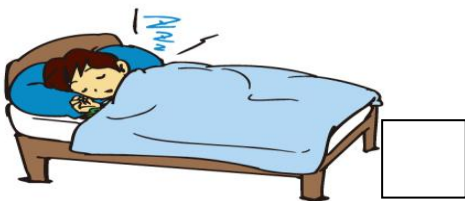
睡眠を十分にとる