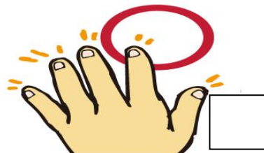
手足の爪は短く切っておく