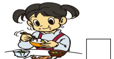
朝食や昼食をしっかりと食べる