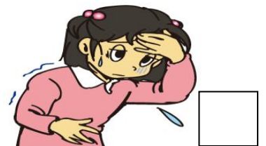
ケガをしているとき、体調がわるいときには入らない