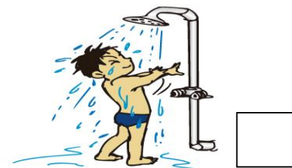
前日はお風呂に入り、プールに入る前、出た後は体をシャワーでよく洗う