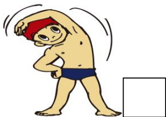
準備運動をきちんとする